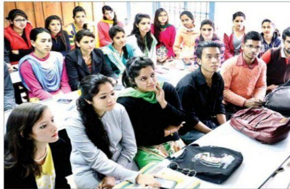
सोलन : पीजी कालेज में पीलिया को लेकर आयोजित जागरूकता कार्यशाला में उपस्थित छात्राएं